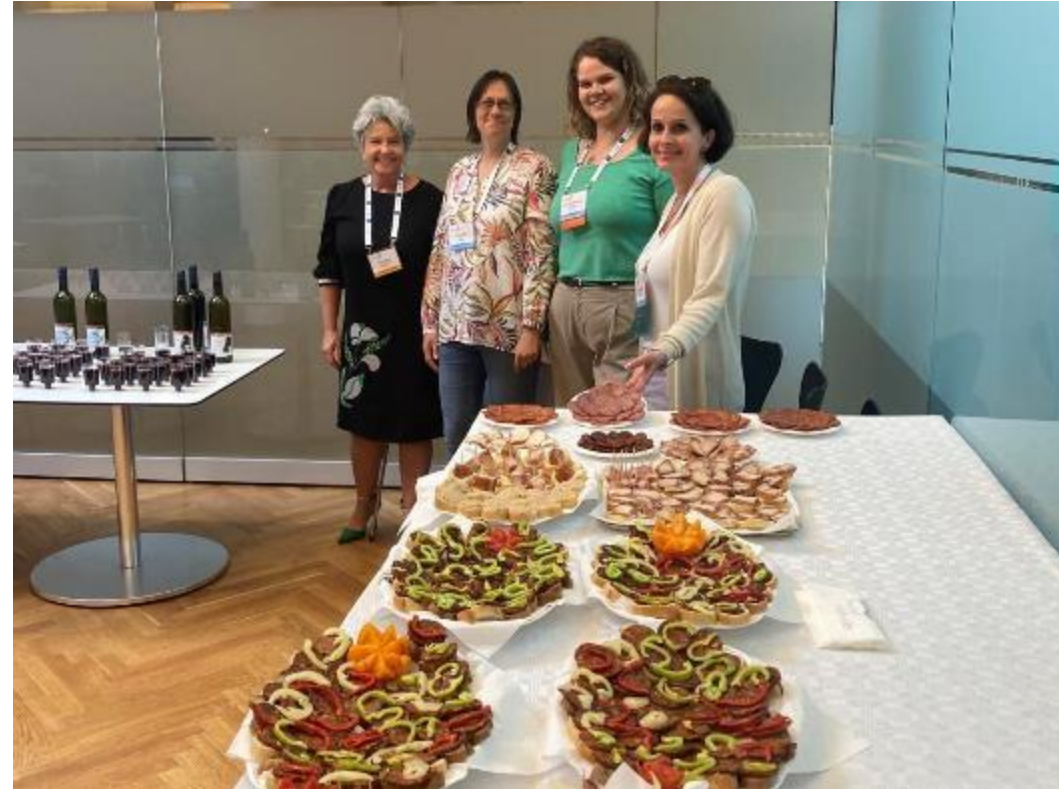
A résztvevők az Aranyponty Zrt. és a Bajcshal Kft. jóvoltából magyaros vendéglátásban részesültek.