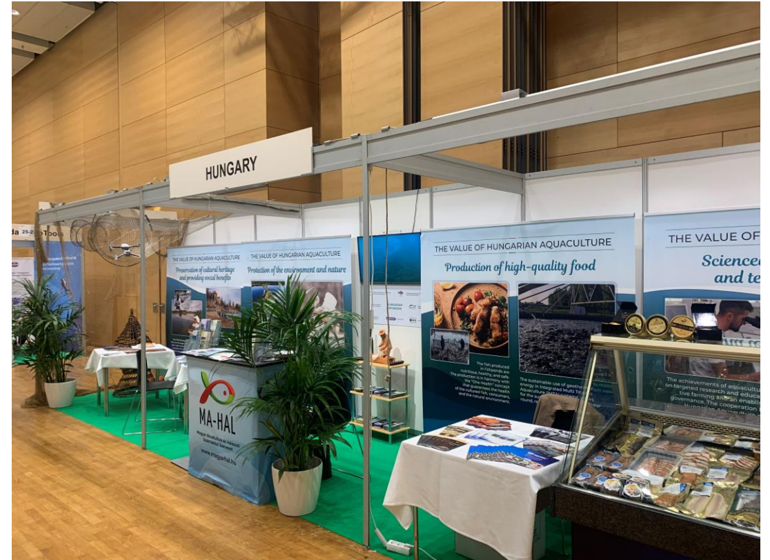
Három standhelyen, 18 m 2 területen mutatkozott be a magyar akvakultúra.