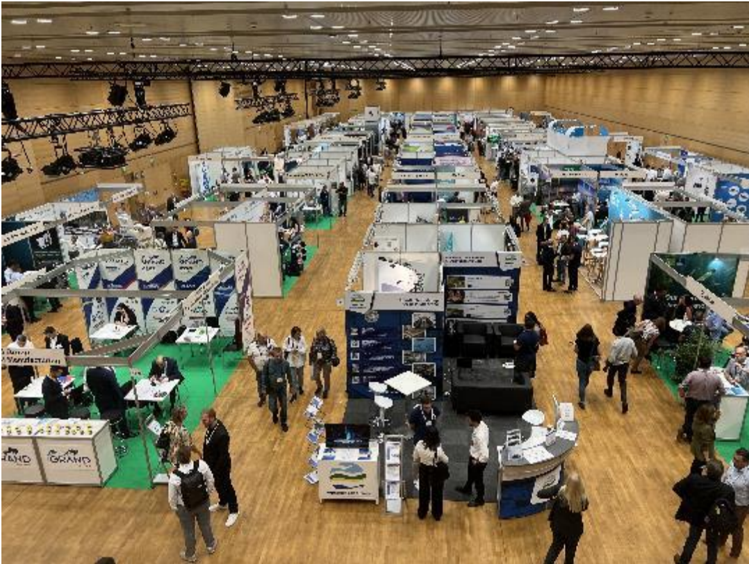
Az Akvakultúra Európa 2023 Szakmai Kiállítás a bécsi vásárcsopontban.

Az Akvakultúra Európa 2023 Konferenciával társítva rendezett Szakmai kiállításon 164 standhelyen több, mint száz európai cég, szervezet és intézmény mutatkozott be. Magyarország egy központi standon mutatta be a magyar akvakultúra értékeit, illetve fogadta az érdeklődőket. A magyar stand létesítésének és működésének költségeit a MA-HAL, a MOHOSZ az Aranyponty Zrt., a Biharugrai Halgazdaság Kft., a Bajcshal Kft. és a Tógazda Zrt. fedezte. A szervező munkát a HUNATiP segítette.