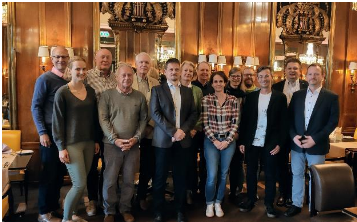
A konferencia teljes szervező csapata.

A nemzetközi szervezőbizottság tagjai a házigazda osztrák szakemberek mellett elsősorban magyar, illetve cseh és német szakemberek voltak.