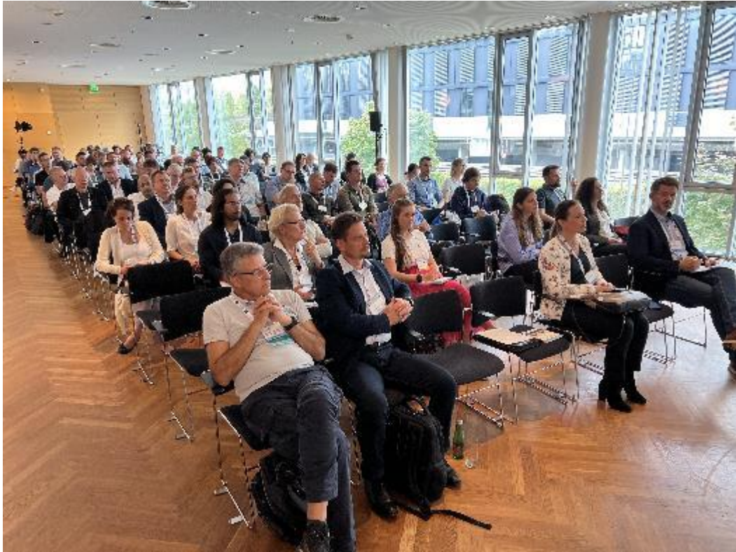
A „Farmer Nap” programjának több mint 50 résztvevője volt.

A 2023. évi bécsi konferencia Farmer Napjának programja kiemelten foglalkozott az édesvízi halgazdálkodás – különösen a tógazdálkodás - kihívásaival, az azokra adható válaszokkal. Az előadók és a panel beszélgetések résztvevői elsősorban magyar és német szakemberek voltak.