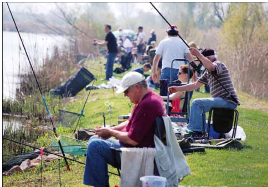
A tóparton minden horgászhely elkelt

de végig kell gondolniuk a szakembereknek, hogy elértük-e a megfelelő állapotot, vagy még tovább kell tisztítani a vizet. A tiszta víz halászati-, hal-, de új fogalomként mondom, horgászatbiológiai szemmel azt jelenti, hogy ebben a vízben nincs elég táplálék, alga, plankton a halmak. S